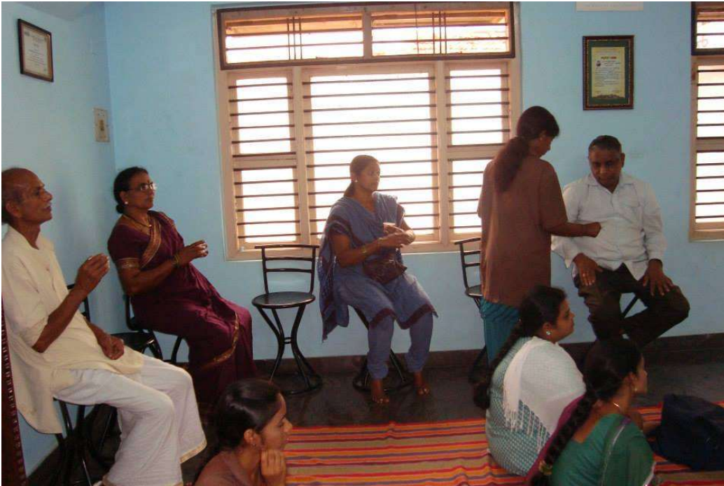
Public attended the programme