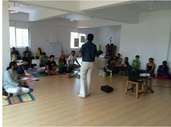
Session 2- What to put in and inside?