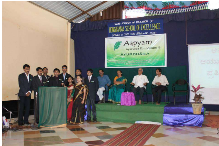
Prayer by the Aapyam Members