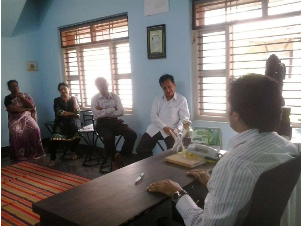
Speech by chairman