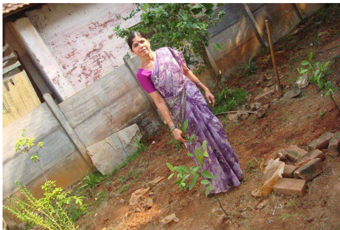
Planting of saplings by public