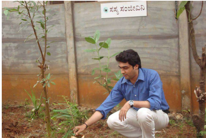
Planting the Amalaiki Sapling