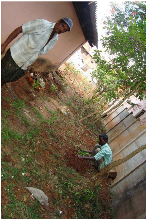
Planting of saplings by public