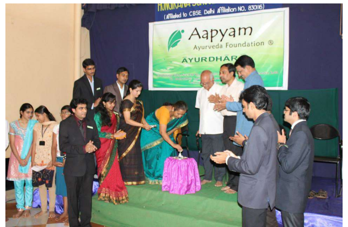
Inauguration of the programme by unique way