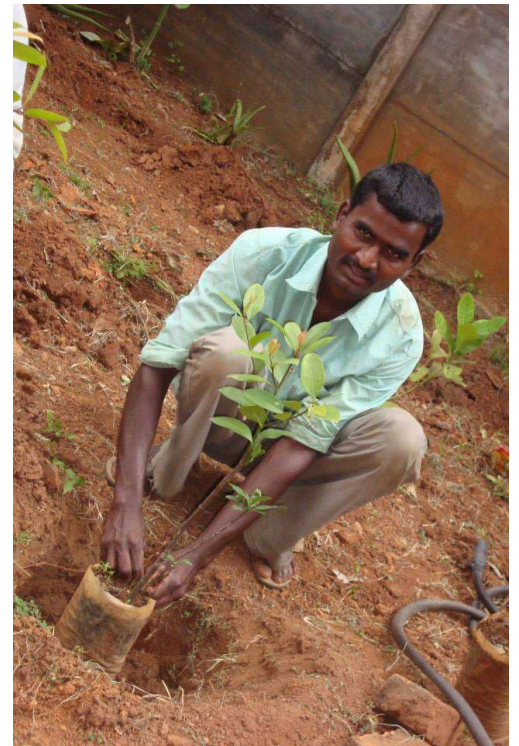
Planting of saplings by public