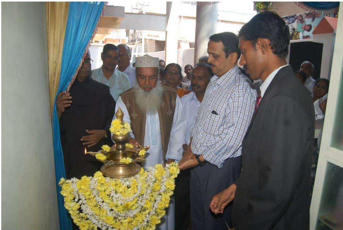
Inauguration of the programme