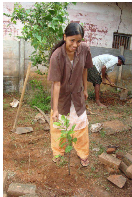
Planting of saplings by staff