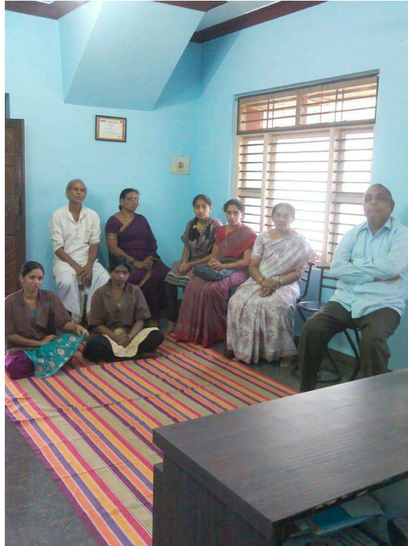
Public at the programme