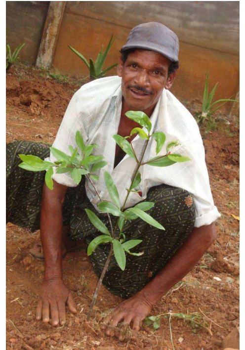
Planting of saplings by public