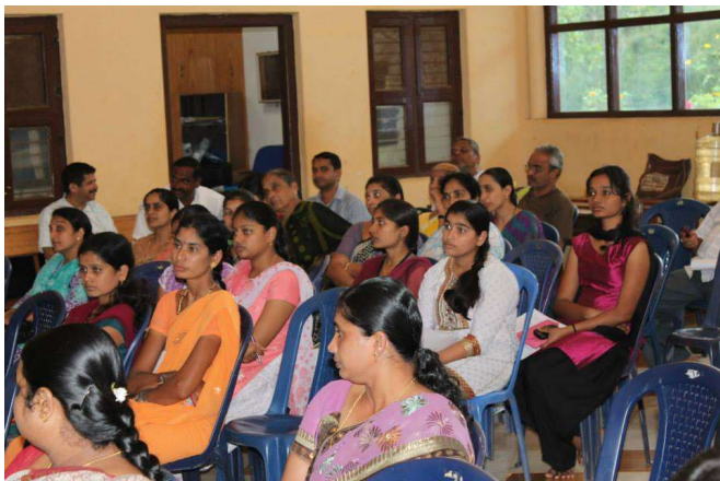
Interaction with the public