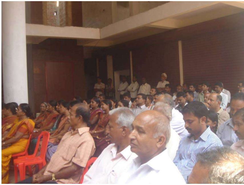
Public attended the programme