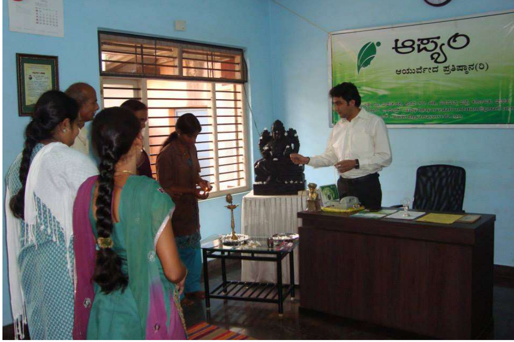
Inaugurating the programme